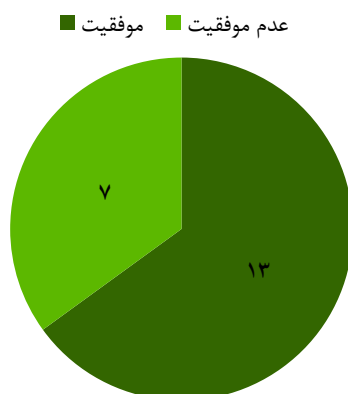
شکل ۱: میزان موفقیت درمان جاناندازی انواژیناسیون با دست از طریق شکم در کودکان تحت گاید سونوگرافی

در مطالعه حاضر، ۹ دختر و ۱۱ پسر مورد بررسی قرار گرفتند که میانگین سنی آن‌ها، ۲۰/۵ ماه بود. محل انواژیناسیون ۷ نفر در کولون صعودی، ۷ نفر در خم کبیدی، ۴ نفر در کولون عرضی و ۲ نفر در خم طحالی قرار داشت. میزان موفقیت درمان جاناندازی انواژیناسیون با دست از طریق شکم، ۶۵ درصد برآورد گردید (شکل ۱).