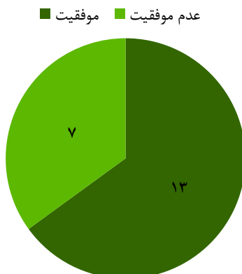
شکل ۱: میزان موفقیت درمان جاناندازی انواژیناسیون با دست از طریق شکم در کودکان تحت گاید سونوگرافی

در مطالعه حاضر، ۹ دختر و ۱۱ پسر مورد بررسی قرار گرفتند که میانگین سنی آن‌ها، ۲۰/۵ ماه بود. محل انواژیناسیون ۷ نفر در کولون صعودی، ۷ نفر در خم کبیدی، ۴ نفر در کولون عرضی و ۲ نفر در خم طحالی قرار داشت. میزان موفقیت درمان جاناندازی انواژیناسیون با دست از طریق شکم، ۶۵ درصد برآورد گردید (شکل ۱).